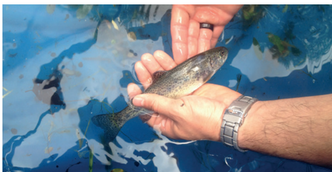
Regenbogenforelle unmittelbar nach der Turbinenpassage

Ergebnisse der Praxistests an einer drehzahlvariablen DIVE-Turbine bei unterschiedlichen Drehzahlen. Zum Vergleich die Mortalitätsraten der drehzahlvariablen DIVE-Turbine nach Berechnungsmodellen für doppelt regulierte Kaplan turbinen.