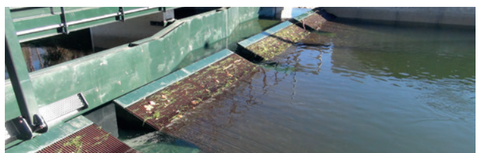
Fischfreundliches Feinrechen-Bypass-System mit vertikal flach zur Sohle geneigten Rechenstäben. Durch Kombination eines fischfreundlichen Feinrechen-Bypass-Systems mit einer fischfreundlichen DIVE-Turbine kann die Gesamtmortalität eines Kraftwerks auf deutlich unter 1% reduziert werden.

Da die Kollisionswahrscheinlichkeit insbesondere auch von der Anzahl der Laufradschaufeln abhängig ist, ist zu erwarten, dass bei einer DIVE-Turbine mit drei Laufradschaufeln (Crampagna: 5 Laufradschaufeln) die Mortalitätsrate noch deutlich niedriger ausfällt. Somit kann in Kombination aus modernen Feinrechen und drehzahlvariablen DIVE-Turbine ein absolut fischfreundliches Kraftwerk realisiert werden, mit einer Gesamtmortalität am Kraftwerk von deutlich unter 1%.